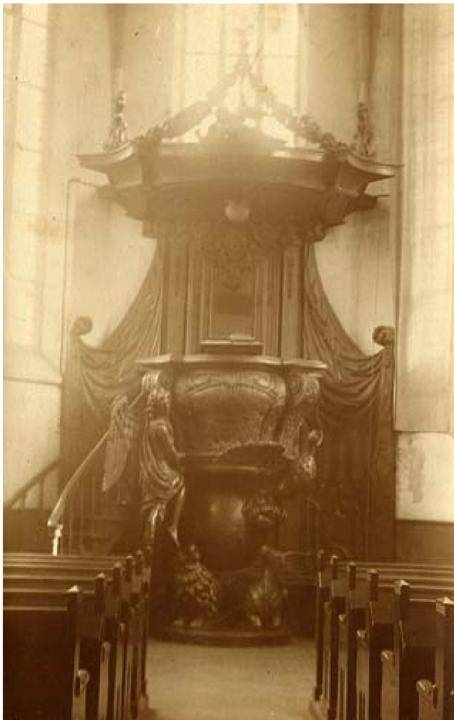
De preekstoel (1930).