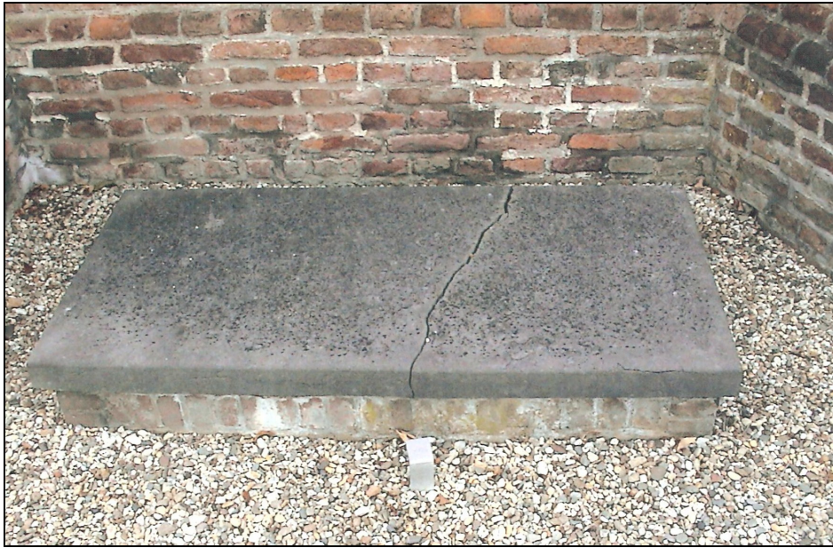
Foto 2: Graf O.66 van mw. Petronella Wilhelmina Mallinckrodt - Swaan