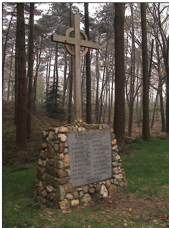
Foto 3: Oorlogsmonument met houten kruis aan de Waterbergseweg te Arnhem