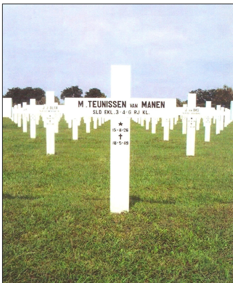
Foto 3: Werkelijke graf te Kembang Kuning Indonesië van Marinus Teunissen van Manen