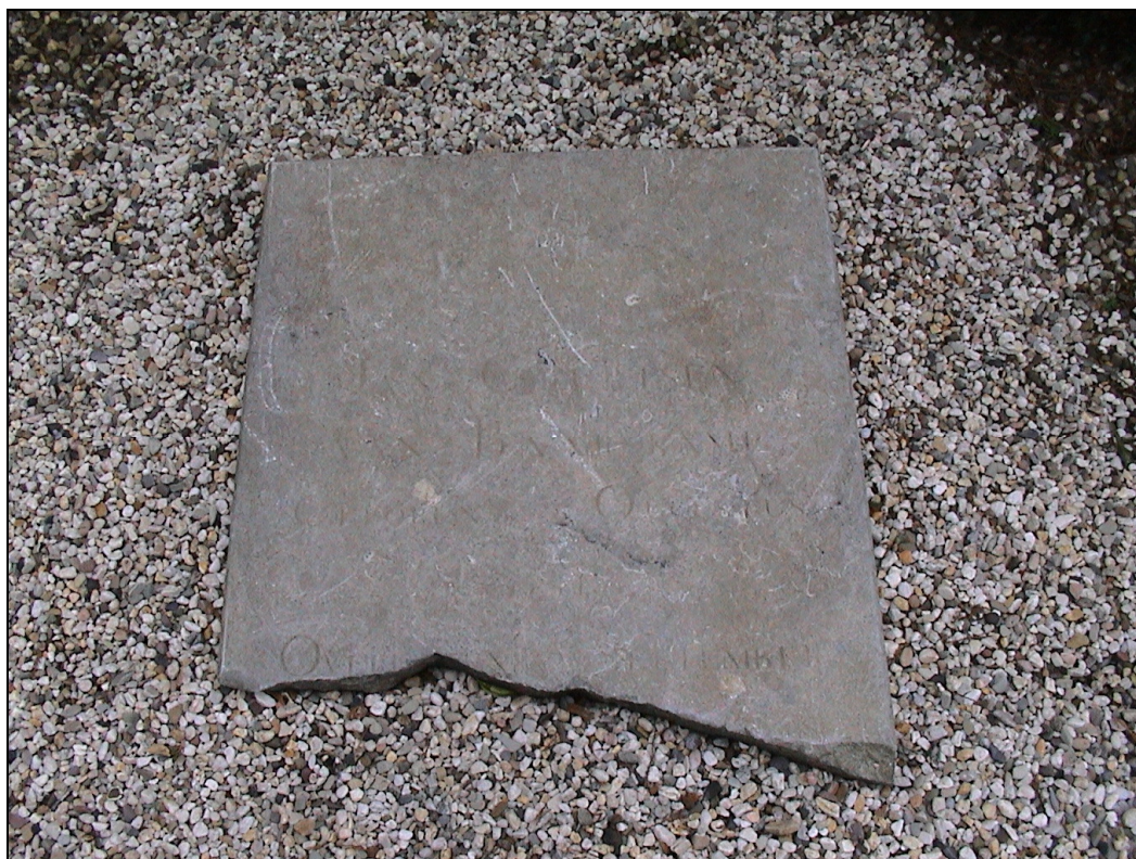
Foto 2: Grafsteen O.111 van Jan Geurtsen van Baarskamp, herplaatst op 19 nov. 2010.