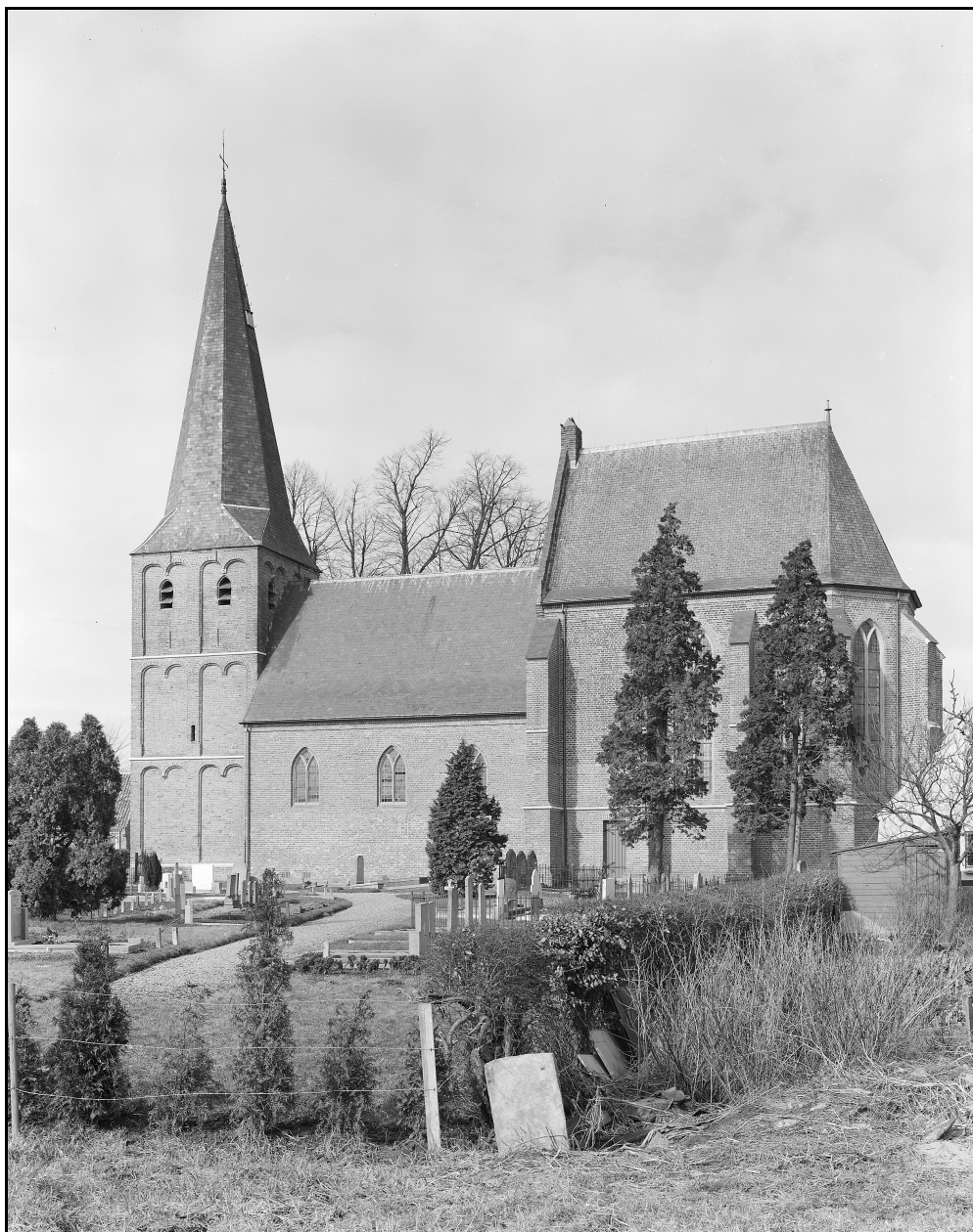
J.R. Alkema, Driel, maart 2011