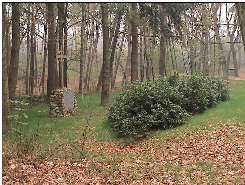
Foto 2: Oorlogsmonument aan de Waterbergseweg te Arnhem waar Gerrit Peters en nog eens achttien mannen werden gefusilleerd.