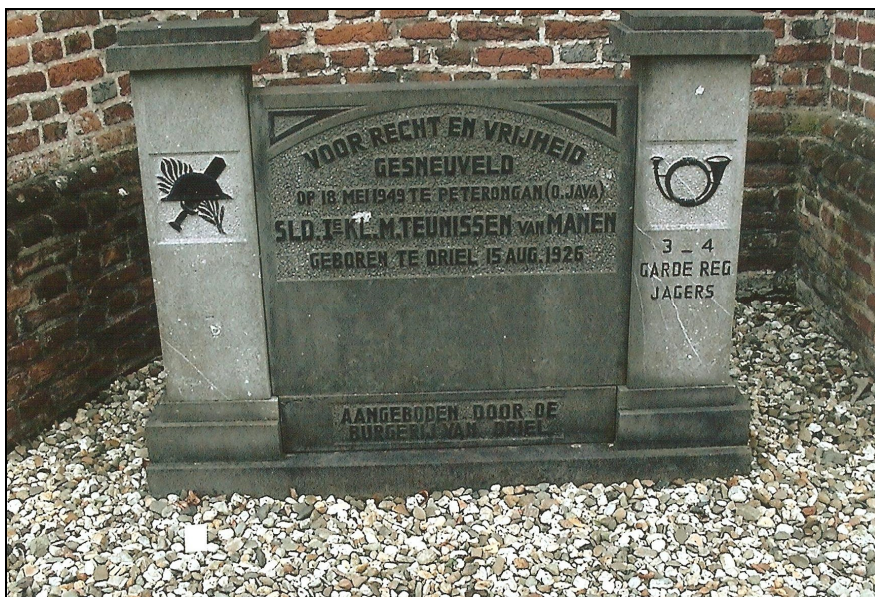
Foto 2: Oorlogsmonument te Driel (graf N.1) van Marinus Teunissen van Manen