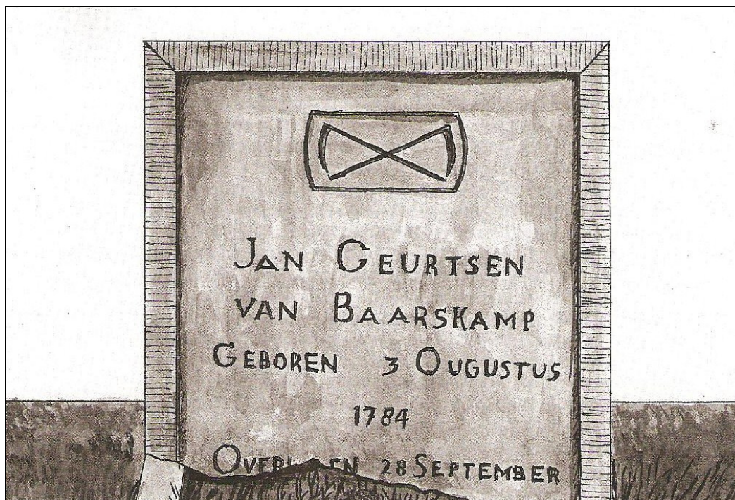
Foto 1: Schets van grafsteen O.111 van Jan Geurtsen van Baarskamp