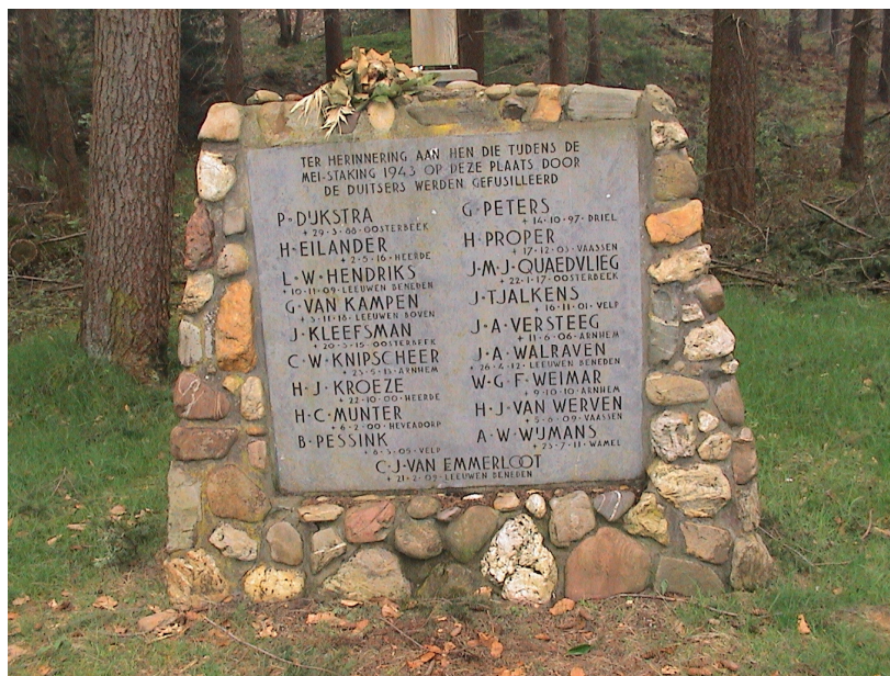
Foto 4: Gedenkplaat met de namen van de gefusilleerde oorlogsslachtoffers met o.a. Gerrit Peters