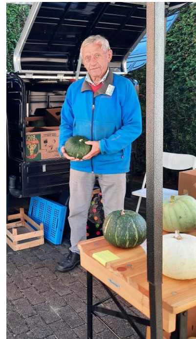
De laatste pompoenen en kalebassen!

Wij willen iedereen die dit jaar weer zijn steentje heeft bijgedragen aan het succes, en/of ook als klant heeft bijgedragen aan de gezelligheid, hartelijk bedanken. Wij als RommelPlusMarkt-commissie zijn dik tevreden.