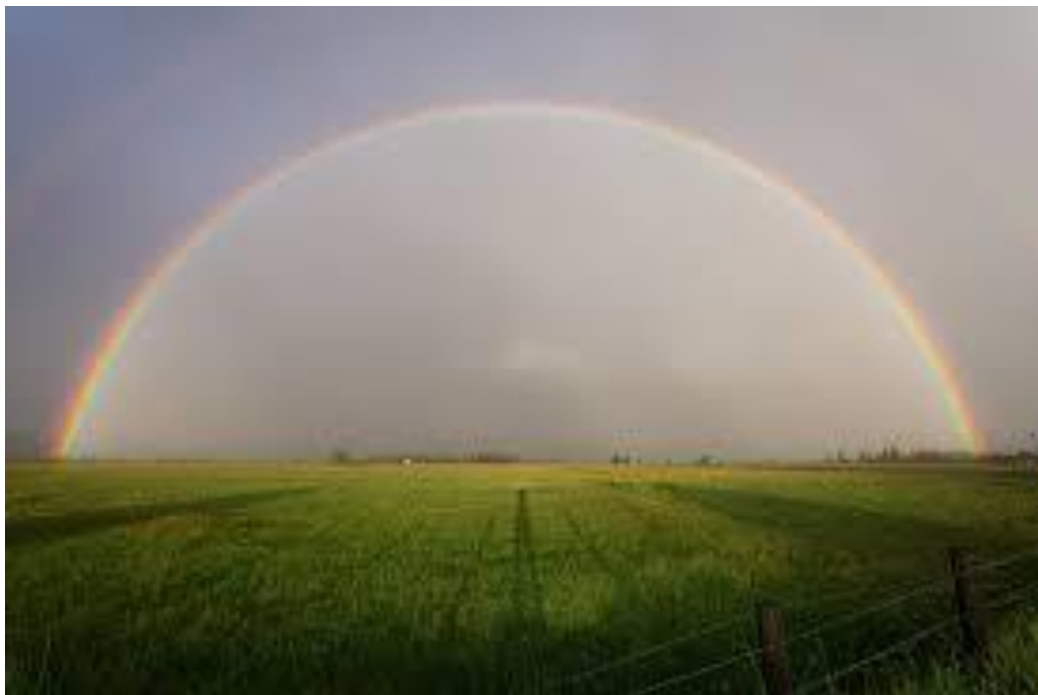
De regenboog – ook een teken van hoop