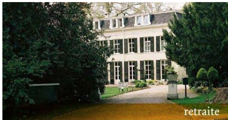
verlangen naar verdieping

Koetshuis en je doet mee met de dagopening in de kapel. De maaltijden worden voor je verzorgd. Goed om te weten!